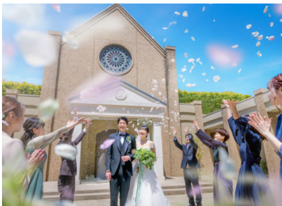
チャペルガーデン / Chapel Garden