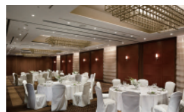
プライベートバンケット「肥後」 Private Banquet Hall HIGO