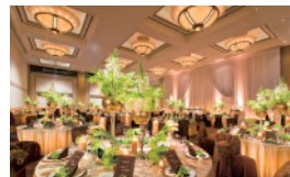
大宴会場「阿蘇」 Banquet Hall ASO